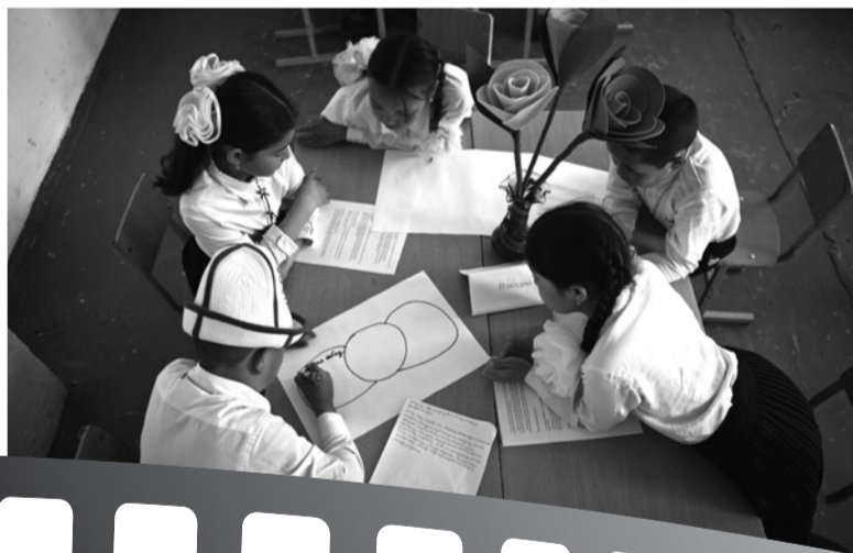
4-класстын окуучуларынын жыйынтыктары